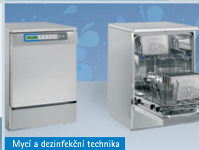
Mycí a dezinfekční technika