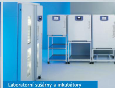
Laboratorní sušárny a inkubátory