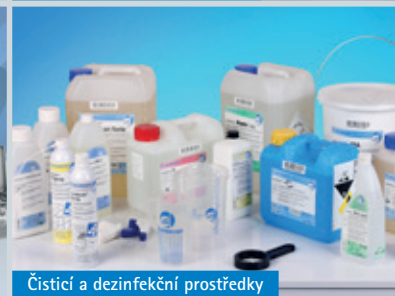
Čistící a dezinfekční prostředky