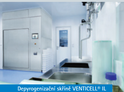
Depyrogenizační skříně VENTICELL® IL