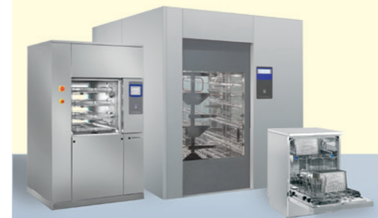
MYCÍ A DEZINFEKČNÍ AUTOMATY