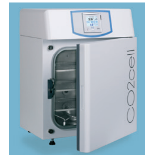
CO2cell 50 Standard