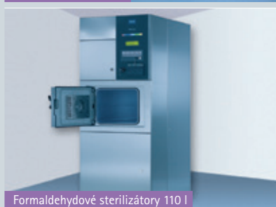
Formaldehydové sterilizátory 110 l