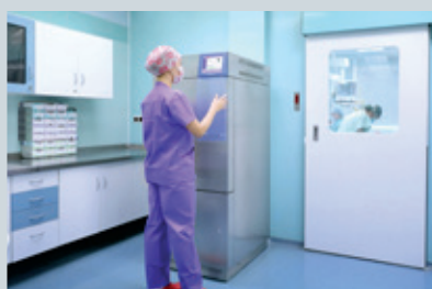
Parní sterilizátory 70 l