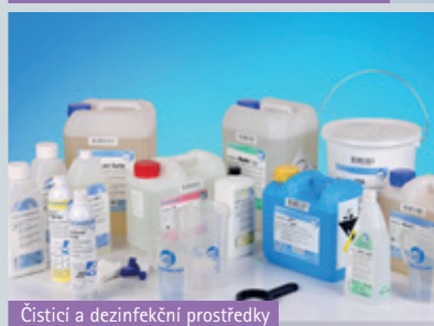
Čističí a dezinfekční prostředky