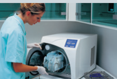
Malé parní sterilizátory 15 - 25 l