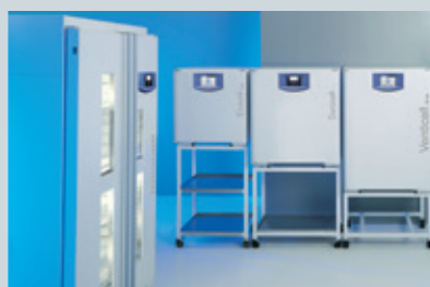
Laboratorní sušárny a inkubátory 22 - 1212 l