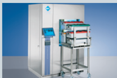
Parní sterilizátory 140 - 2020 l