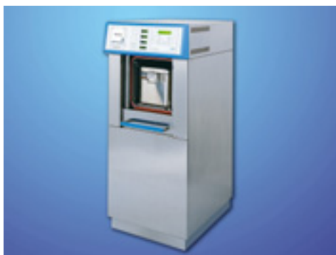
Dampfsterilisator UNISTERI 70 l