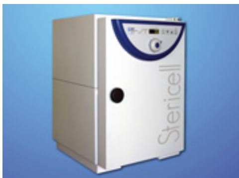
Heißluftsterilisator STERICELL 22, 55, 111, 222 und 404 l