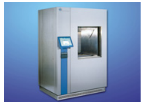
Dampfsterilisator STERIVAP HP 140 - 1280 l